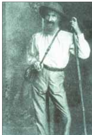
2 Fritz Müller