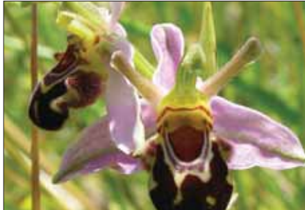
5 Orhideja - zapeljivka