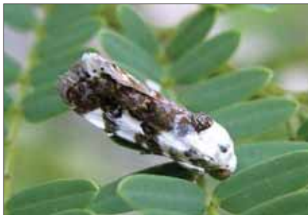
3 Acontia aprica – preživetje s ponižanjem