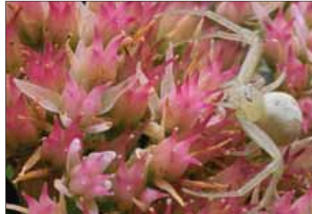
6 Rakovičasti pajek

(4.) Odkritij na tem področju še ni konec. Če je do nedavnega veljalo, da živali, ki so sposobne mimikrije, v teku življenja oponašajo le eno vrsto 11 , je bila l. 1998 v estuarijih sulavezijskih rek (Indonezija) odkrita mimična hobotnica ( thaumoctopus mimicus , glej slikovni par 2), ki je sposobna izmenično oponašati več živalskih vrst: vodno kačo, levjo ribo, morskega lista, pa še katero. Odkritje, vredno agencijskih poročil. 12 V vseh primerih gre za obrambno mimikrijo batesovih različic, saj so vsi modeli (za razliko od mimika) strupeni. Hobotnica svojo mimikretično akcijo celo prilagodi trenutnemu operatorju (plenilcu), tako da oponaša ravno tisti model, ki operatorja najbolj odbija.