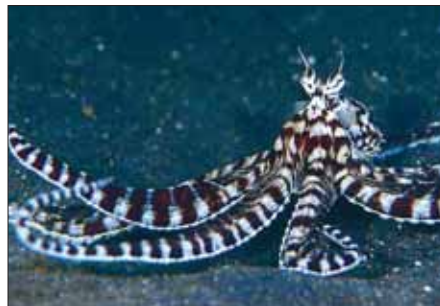
4 Thaumoctopus mimicus – velemojster mimikrije

Številne živali se zavarujejo tako, da oponašajo neužitne dele svojega možnega plenilca. Skrajna oblika tega je na primer avstralski ptičjeiztrebkarški pajek (ang.