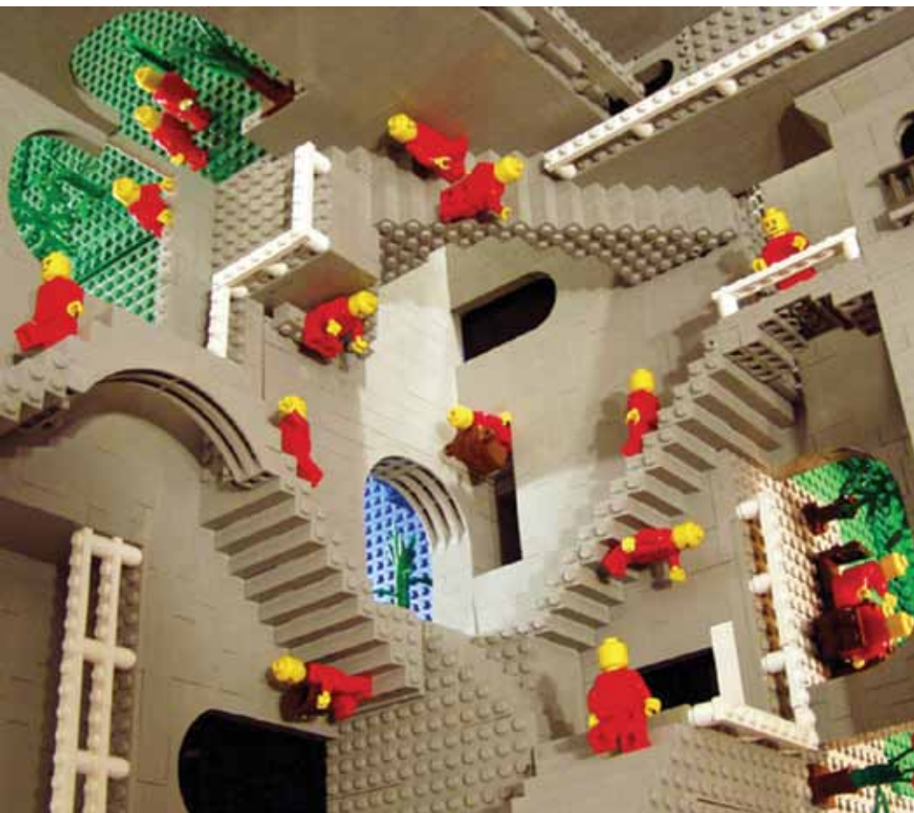
SLIKA 1: RELATIVNOST